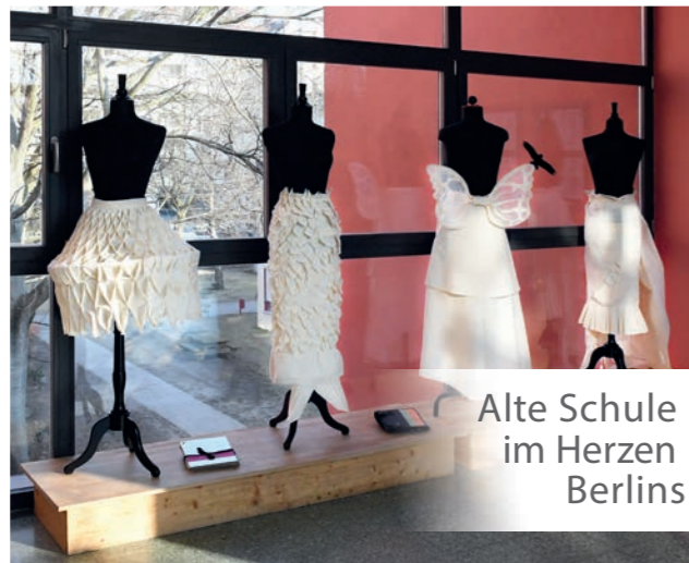
Alte Schule im Herzen Berlins

STUDIENBEFÄHIGUNG Sie erwerben mit Bestehen der Abschlussprüfung der Fachoberschule die Fachhochschulreife, mit der Sie sich an jeder Fachhochschule für jedes Studium bewerben können. In der gymnasialen Oberstufe bieten wir den (Leistungs-)Kurs Modedesign an.